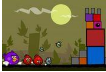
Jaakko Iisalo's original concept art for an "Angry Birds" game.

L'idée était de choisir la couleur de l'oiseau correspondant à la couleur du bloc. Les oiseaux n'ont pas d'aptitudes spéciales mais le joueur récupère des œufs qui sont des power-ups (12). Ensuite a été introduit le mouvement pour lancer les oiseaux sur les constructions d'abord avec le doigt puis avec le lance-pierre qui était plus intuitif (12, 13). Les cochons ont été introduits après pour donner une motivation à la destruction des constructions avec le prétexte du vol des œufs des oiseaux (12, 13). Rovio s'appuyait sur les succès et les échecs de ses jeux passés mais aussi sur de nombreux tests auprès du personnel et de son entourage pour construire la mécanique d'Angry Birds (4). Angry Birds est le résultat d'une stratégie délibérée de hit conçue par Mikael et Niklas. Niklas affirme que : "This was our most calculated game," (4).