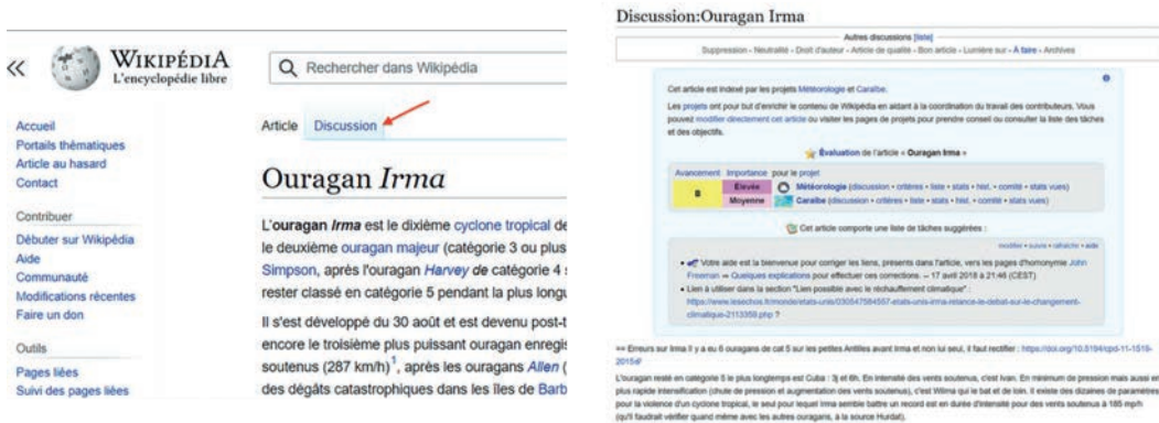
Figure 1 : Capture d'écran de la page de discussion de Wikipédia relative à l'ouragan IRMA

articles concernant des événements d'actualité (Keegan et al. , 2013). Avant d'être une encyclopédie généraliste, Wikipédia est utilisée par les internautes comme un moyen d'obtenir de l'information sur un événement en cours ou récent : c'est un lieu en ligne incontournable, quelle que soit l'actualité (décès d'une personnalité célèbre ou autre événement d'actualité). L'encyclopédie en ligne donne par ailleurs lieu à de nombreux échanges entre les contributeurs, que l'on retrouve dans les onglets « discussions » présents pour chacune des pages Wikipédia (Figure 1).